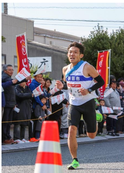
師走の石見路でたすきをつなぐ 「しおかぜ駅伝」

また、駅伝やマラソンなどのイベントを通じて、地元の人と市外の人との交流が深まるなど、浜田市との関わりがいろいろな形で広がっています。