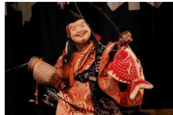
福と笑顔をもたらす釣り姿は結婚式でも大人気「恵比寿」

令和元年5月20日に 日本遺産構成文化財の一つに認定 された「石見神楽」は、市民の生活に深く根付いており、伝統芸能でありながらも氏神様への奉納や市民の娯楽として時代とともに進化し、発展を続けています。市内の各所で年間を通して神楽が舞われ、老若男女を問わず親しまれています。