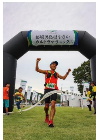
弥栄町全域をコースとした 「秘境奥島根やさかウルトラマラニック」