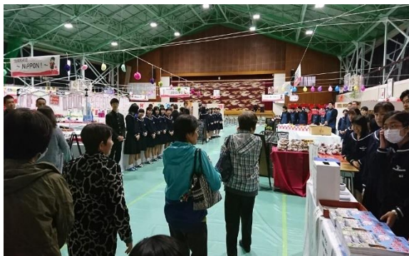
「働く」を実践 浜商デパート