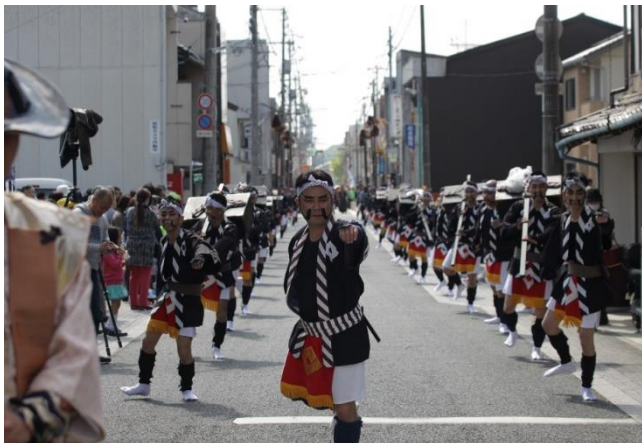
大名行列が市内を練り歩く「浜っ子春まつり」