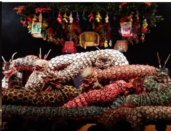
氏神様への奉納や市民の娯楽として親しまれている 伝統芸能「石見神楽」