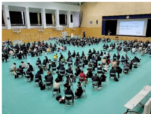
地域住民との1対1の対話イベント

市内には県立高校が3校あります。それぞれが、「生きる力」を育むことを目的に、地域社会と協働による魅力ある高校づくりに取り組んでいます。