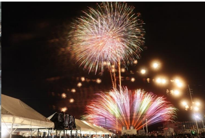
浜田港の夜空を花火が彩る「浜っ子夏まつり」