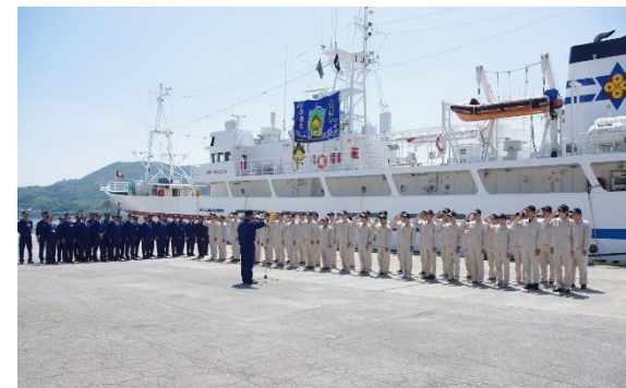
全国最大級の実習船と、 全国で26校しかない専攻科を保有

水産・海洋の専門的な知識と技術を身に付けることができます。大型船舶、小型船舶といった船の資格や潜水士、食品技能検定など多くの資格取得も可能で、地元企業との商品開発なども行います。近年、しまね留学により県外からの入学生もあり、寮も充実しています。部活動では、カッター部があり、全国大会に出場した経験もあります。