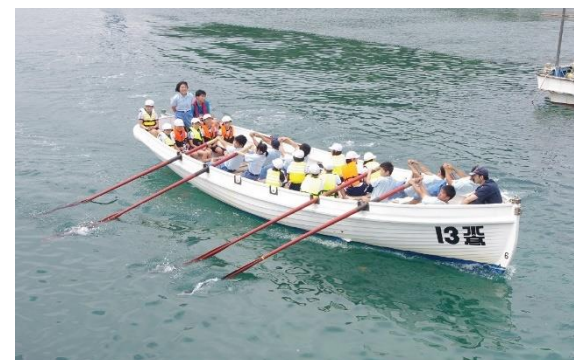
地元小学生とのカッター体験交流